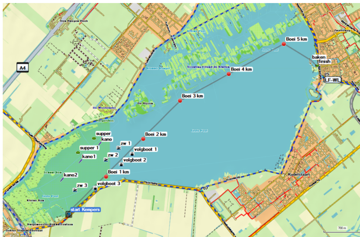
Overzicht van 6 en 3 km parcours