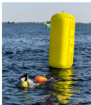
Een voorbeeld van een boei: de boei houd je altijd aan je rechterkant.

De 6 km zwemmers die na 1 uur 20 minuten niet het 3 km punt zijn gepasseerd, zullen uit het water 'gehaald worden' naar het surfeiland gebracht worden.